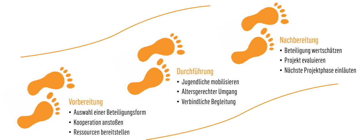
► Abb. 2: Die drei wesentlichen Schritte eines Jugendbeteiligungsprozesses