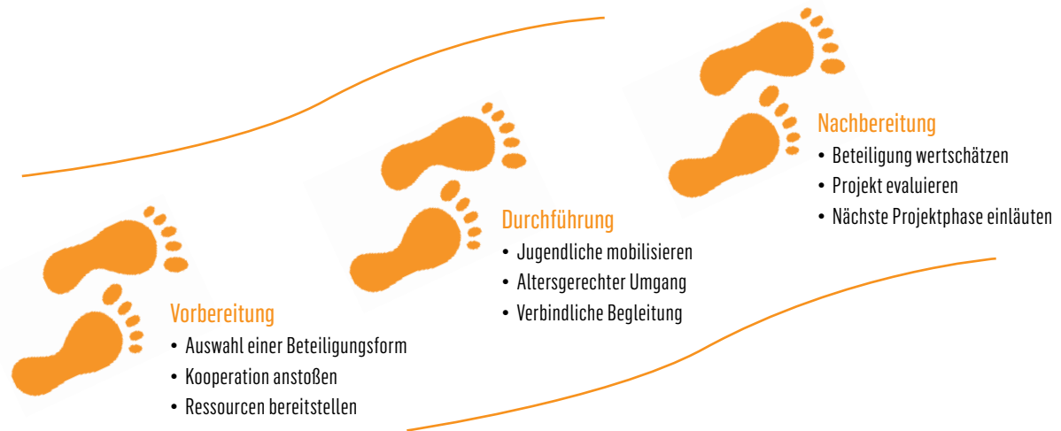
► Abb. 2: Die drei wesentlichen Schritte eines Jugendbeteiligungsprozesses